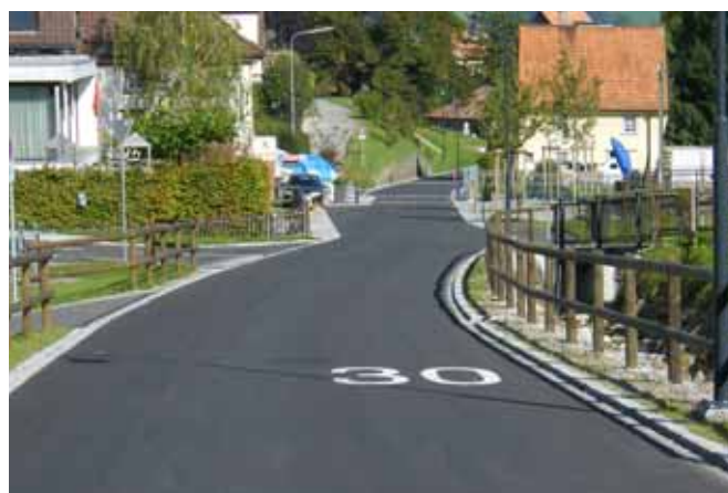
Tempo 30 Zone