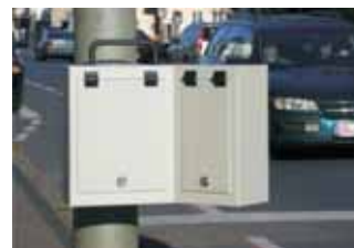
Messungen mittels Radar Viacount 2